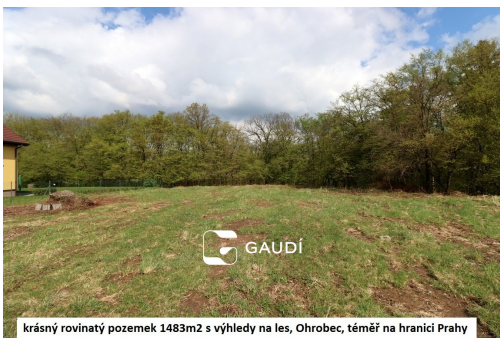
krásný rovinatý pozemek 1483m2 s výhledy na les, Ohrobec, téměř na hranici Prahy