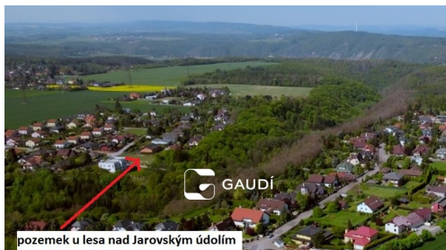
pozemek u lesa nad Jarovským údolím