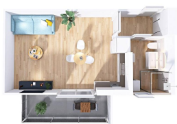
BYT 1+KK S TERASOU A PARK. STÁNÍM, NA KŘTALTĚ, ZABŘEH

*Plocha místnosti a umístění vybavení je pouze orientační