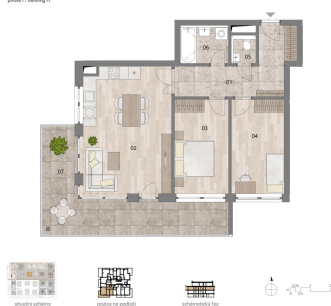
Nové Chabry / etapa I / budova H