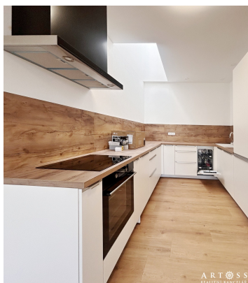
2+kk, 59 m 2 + samostatný sklep 25 m 2