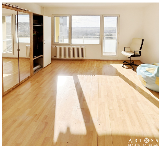
CP 80 m2, 3+1 Bosonožská + sklep + balkon

Bosonožská, 62500, Brno-Starý Lískovec, Brno