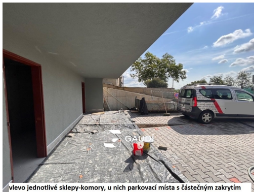
vlevo jednotlivé sklepy-komory, u nich parkovací místa s částečným zakrytím