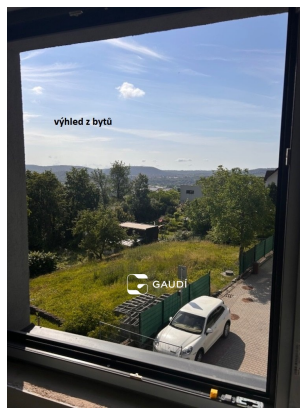
výhled z bytu