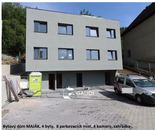
Bytový dům MAJÁK, 4 byty, 8 parkovacích míst, 4 komory, zahrádka