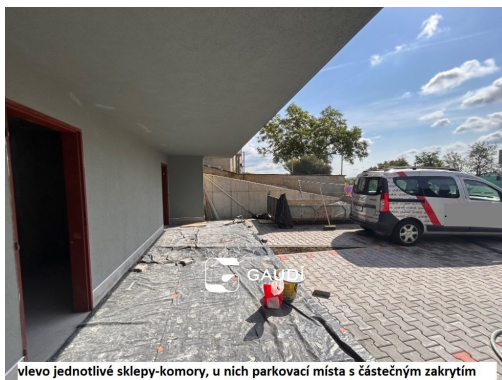
vlevo jednotlivé sklepy-komory, u nich parkovací místa s částečným zakrytím