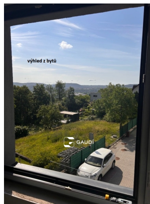
výhled z bytu