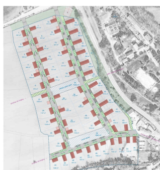
Domy pod Řípem