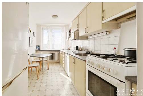
CP 80 m 2 , 3+1 Bosonožská + sklep + balkon

Bosonožská, 62500, Brno-Starý Lískovec, Brno