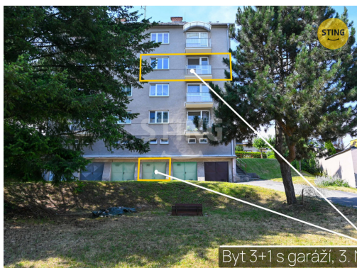
Byt 3+1 s garáží, 3. NP