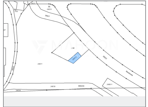
Obrázek č. 1: výřez z územního plánu s vyznačením (červené zvýraznění) oceňovaného pozemku